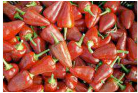
Am Anfang waren 16.000 Setzlinge. Acht Monate lang wuchsen sie heran, bis die fingerlangen Schoten geerntet werden konnten.