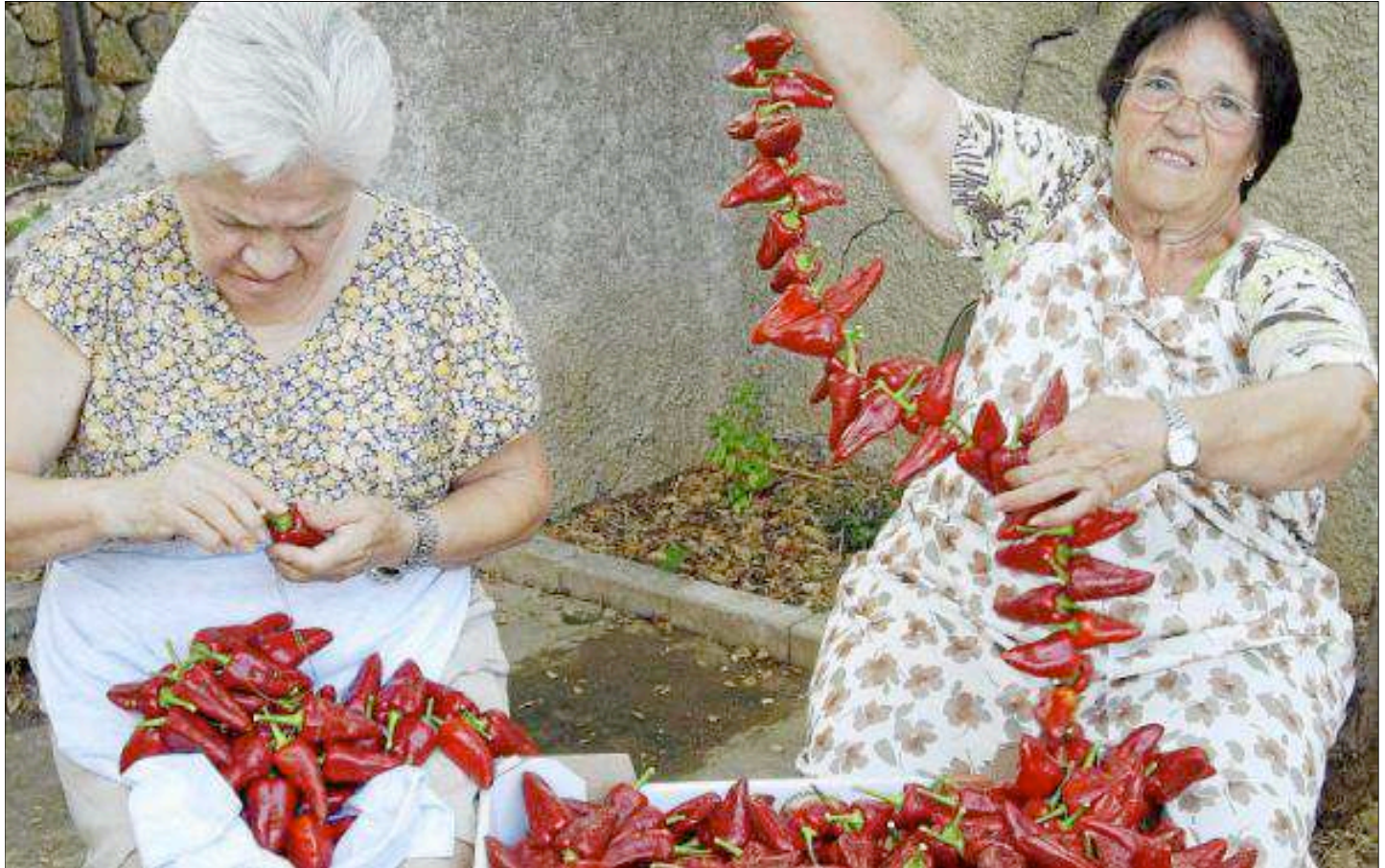
Die Anwohner von Santa Maria hatten Spaß daran, die Schoten aufzufädeln, um sie aufhängen zu können. Eine Heidenarbeit – aber eine Methode, die sich für die Qualität des Paprikapulvers auszahlt.